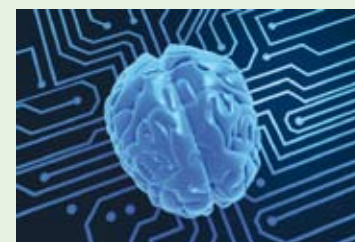
Analyse vidéo processeur

Il est bien connu que deux yeux voient mieux. C'est la raison pour laquelle nous avons, en tant que fournisseur leader de solutions de sécurité, développé un processeur de comptage de personnes ayant un système de caméra stéréo. Il est ainsi possible d'avoir une évaluation encore plus précise.