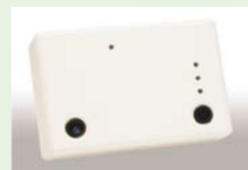
Overhead Peoplecount avec l'analyse la plus précise

Informations et conseil sans engagement au 058 445 48 36