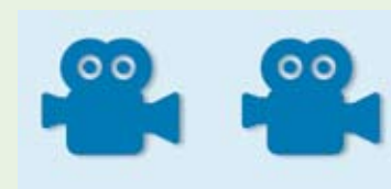
Système de caméra stéréo