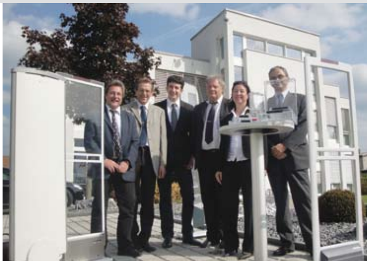
Le centre suisse de compétence pour les produits Sensormatic est à Egerkingen

La sécurisation des marchandises protège votre entreprise contre la démarque inconnue. Plus de 32 milliards de produits sont pourvus d'étiquettes de sécurité de Tyco ADT. Nos systèmes de sécurisation de marchandises sont non seulement leaders, mais présentent également le taux de détection le plus élevé au monde. Le taux de détection décrit la fréquence avec laquelle une étiquette de sécurité reconnaît une étiquette de sécurité par rapport aux étiquettes non reconnues.